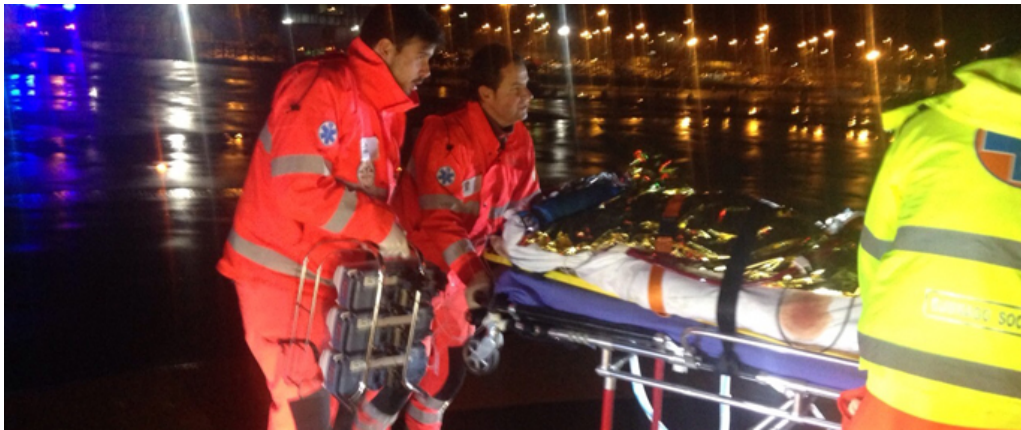
L'arrivo dell'equipaggio del 15° Stormo - 83° Gruppo di Cervia a Pieve di Coriano (MN)

La sera del 21 gennaio 2015 alle 20.10 l'equipaggio che garantisce il servizio di ricerca e soccorso (SAR) del 15° Stormo - 83° Gruppo di Cervia , ha ricevuto l'esecutivo per un trasporto sanitario di un paziente in imminente pericolo di vita per endocardite acuta da Pieve di Coriano (MN) all'ospedale San Raffaele di Milano .